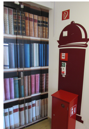
Visueller Ablenker: „Lifafaßsäule“ Wandtattoo, ca. 165 cm x 60 cm. Ab 68,00 Euro.