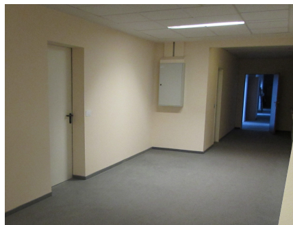
Vorher / Nachher: Visueller Ablenker Bücheregal. Fototapete ca. 90 cm x 200 cm. Ab 110,00 Euro.

Mit einer bedarfsorientierten Raumgestaltung kann man Wege lenken, Wichtiges betonen und Unwichtiges verbergen. Für dementiell veränderte Menschen können manche Bereiche schnell zu Gefahrenquellen werden. Mit einer angepassten Farbgebung und ausgewählten Gestaltungselementen kann man von Tabubereichen ablenken, umlenken bzw. diese visuell verschwinden lassen und den Blick auf andere Dinge forcieren.