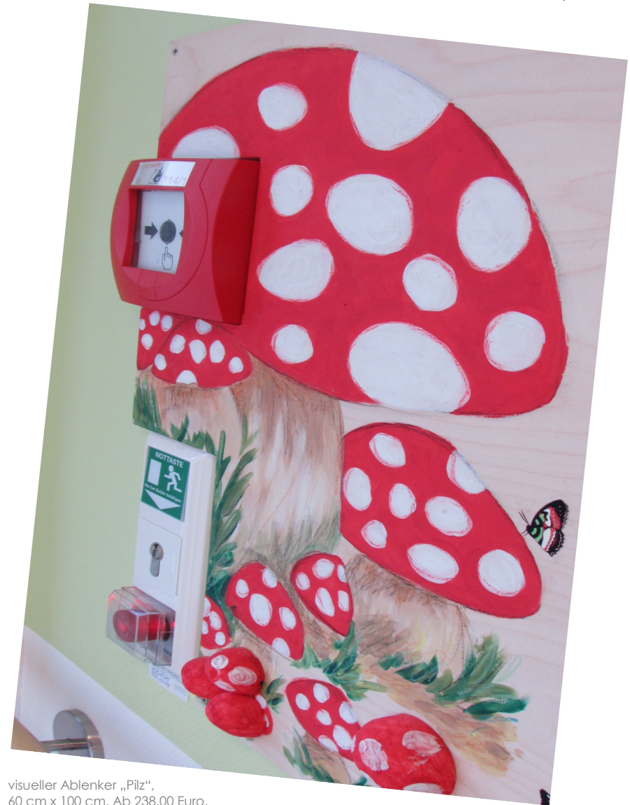
visueller Ablenker „Pflanz“, 60 cm x 100 cm. Ab 238,00 Euro.