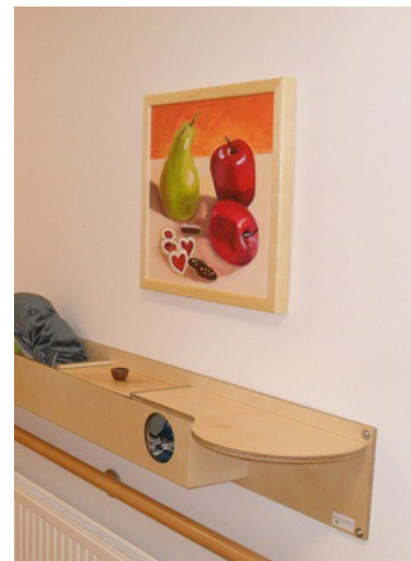
Erlebnisboard mit Foodstation, Klappfach u. Spieluhr. Vollholz nach Wahl. Bei Bedarf themenorientiert bestückt. 126 cm x 22 cm. Ab 298,00 Euro.