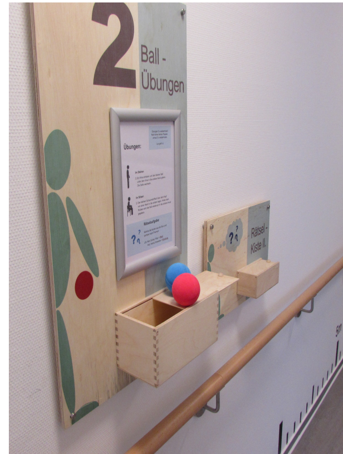
Indoor- Trimm- Dich- Parcours mit Rätselbox.