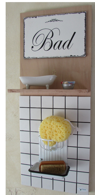
Erlebnisorientierte Türschilder, themenorientiert bestückt. Multiplex Buche, 30 cm x 75 cm. Ab 112,00 Euro.