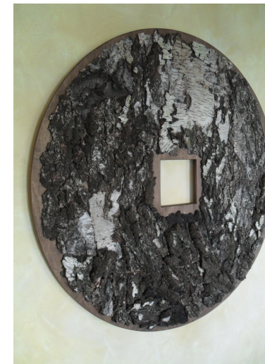
Dreidimensionales Naturelement als Tastparcours. Z.B 100 cm x 100 cm. Bestückt mit Birkenrinde. Ab 364,00 Euro.